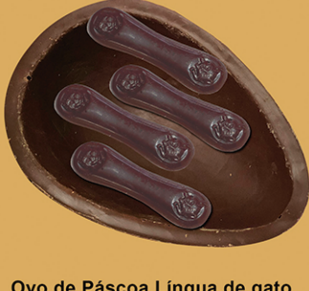
Ovo de Páscoa Língua de gato 50% cacau Infantil 300g Cód.: 7 897035600601