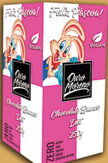
Ovo de Páscoa Branco Diet com Leite de coco 250g Cód.: 7 897035602339