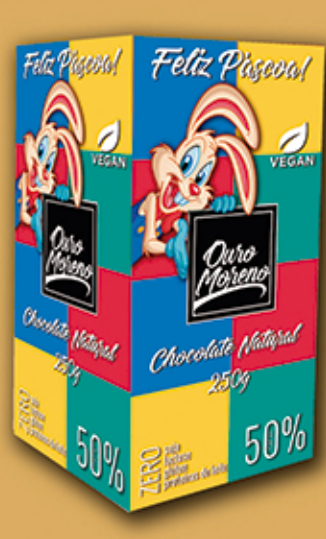
Ovo de Páscoa 50% cacau Infantil 250g Cód.: 7 897035600618