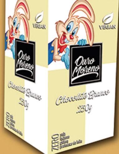
Ovo de Páscoa Branco com Leite de coco 250g Cód.: 7 897035600793