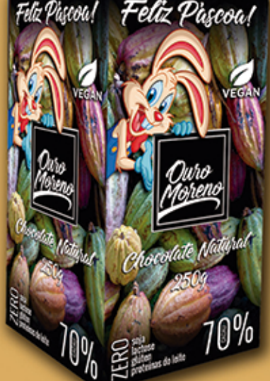
Ovo de Páscoa 70% cacau Adulto 250g Cód.: 7 897035600762