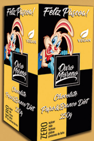
Ovo de Páscoa Puro & Branco Diet com Leite de coco 250g Cód.: 7 897035600786