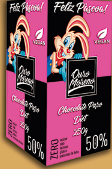
Ovo de Páscoa Puro 50% Diet 250g Cód.: 7 897035602186