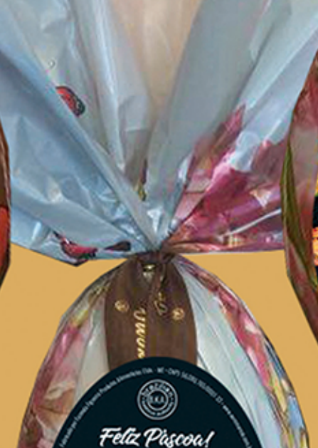
Ovo de Páscoa 70% cacau Adulto 250g Cód.: 7 897035600762