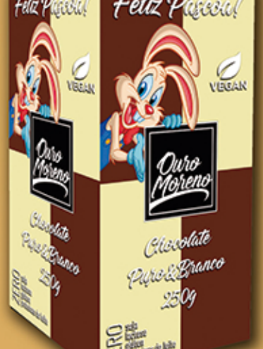
Ovo de Páscoa Puro & Branco com Leite de coco 250g Cód.: 7 897035600779