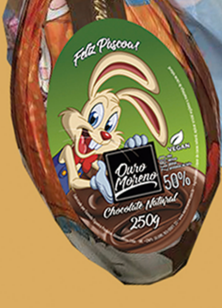
Ovo de Páscoa 50% cacau Infantil 250g Cód.: 7 897035600618