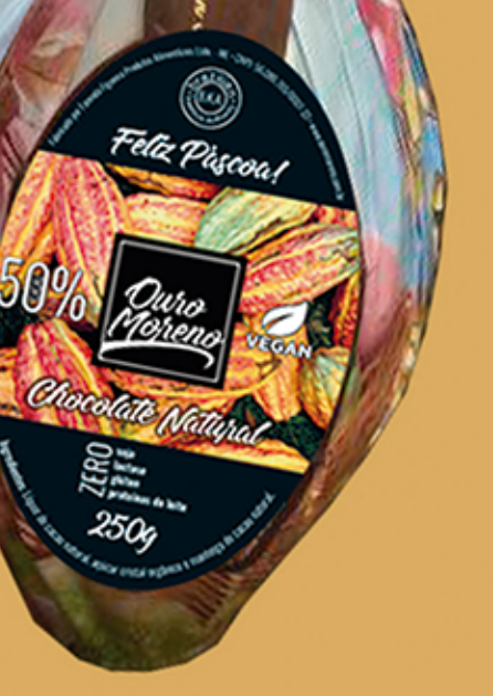
Ovo de Páscoa 50% cacau Adulto 250g Cód.: 7 897035600618