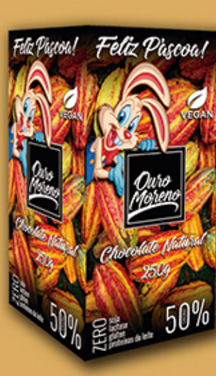
Ovo de Páscoa 50% cacau Adulto 250g Cód.: 7 897035600618